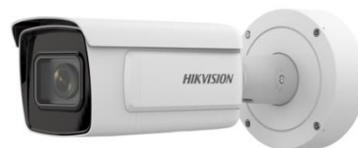
Afbeelding 2 Ondersteunende camera

Of de camera nu reageert op mensen of voertuigen, de DeepinView-serie probeert altijd meer te zien dankzij de Deep Learning-algoritmes binnenin. Ze leggen meer gezichten in één frame vast bij veel bredere kijkhoeken; ze detecteren en onderscheiden mensen en voertuigen van andere objecten met een hogere nauwkeurigheid; ze herkennen voertuigkentekenplaten met een nauwkeurigheid van meer dan 98%; en ze analyseren mensenstromen door de wachttijd en -status te detecteren voor optimale inzet van beschikbare middelen tijdens piekuren. De DeepinView-camera's bieden niet alleen video- en beeldgegevens, het gaat om het inzicht dat u nodig hebt voor een slimmere en veiligere wereld.